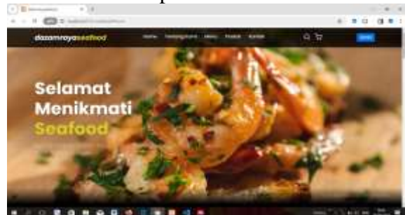
Gambar 4. 1 Tampilan halaman utama aplikasi

pengguna menyatakan bahwa website sudah menjawab kebutuhan pengguna dan berjalan sesuai fungsinya. Artinya website sudah matang dan dievaluasi, hasil akhirnya menjadi aplikasi website dan siap digunakan. Berikut adalah tampilan dari halaman aplikasi. Gambar 2 merupakan tampilan halaman utama aplikasi