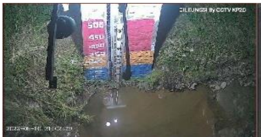
Gambar 1. Hulu Cileungsi Pada Tanggal 10 Mei 2023

Stasiun BOGOR-1, ONLIMO DAS Bekasi Hulu terletak di Jl. Pesona Den Haag, Nagrak, Kec. Gunung Putri, Kab. Bogor. Tanggal pengambilan data penelitian ini di website onlimo adalah 10 Mei 2023.