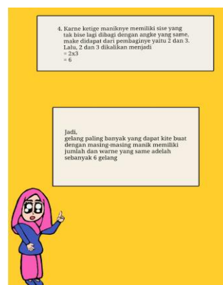
Gambar 3. Hasil dari pengelompokan manik-manik

Teknik kedua yang disajikan dalam BBM yaitu menggunakan pohon faktor (Gambar 4). Teknik ini dapat dikategorikan sebagai teknik formal yang biasa dijumpai di buku-buku pelajaran siswa sekolah dasar. Langkah pertama yaitu mencari faktorisasi prima dari masing-masing bilangan. Selanjutnya FPB dari ketiga bilangan tersebut diperoleh dengan cara mencari faktor yang sama dengan pangkat terkecil sehingga diperoleh 2 \times 3 = 6 .