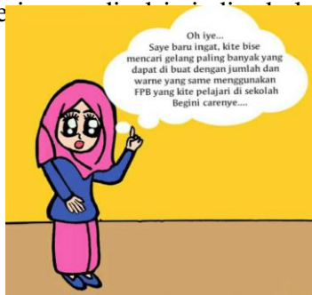
Gambar 5. Teknologi dan teori yang disajikan dalam BBM

Sementara itu pernyataan Ani bahwa mereka dapat mencari gelang paling banyak yang dapat dibuat dengan jumlah dan warna yang sama menggunakan FPB merupakan teknologi untuk menjustifikasi teknik yang mereka gunakan (Gambar 5). Dalam hal ini, mereka merefleksikan apa yang telah mereka pelajari di sekolah. Sehingga, FPB dapat diartikan sebagai teori matematis yang harus dipelajari siswa dan merupakan bagian dari materi matematika yang diajarkan di sekolah dasar.