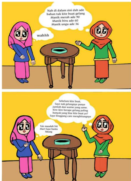
Gambar 1. Soal matematika yang disajikan dalam BBM

BBM ini menyajikan dua teknik atau cara untuk menyelesaikan soal tersebut. Teknik pertama yaitu manik-manik dikelompokkan sesuai dengan warnanya (Gambar 2). Selanjutnya masing-masing manik-manik dibagi mulai dengan bilangan prima terkecil yaitu 2, kemudian dilanjutkan membagi manik-manik dengan bilangan prima lainnya, yaitu 3, sehingga diperoleh 15 manik-manik merah, 10 manik-manik biru, dan 6 manik-manik ungu. Hasil akhir ini tidak dapat lagi dibagi dengan angka yang sama sehingga diperoleh banyak gelang yang dapat dibuat yaitu 6 gelang ( 2 \times 3 ) (Gambar 3).