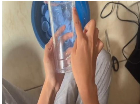
proses pemotongan wadah vas bunga