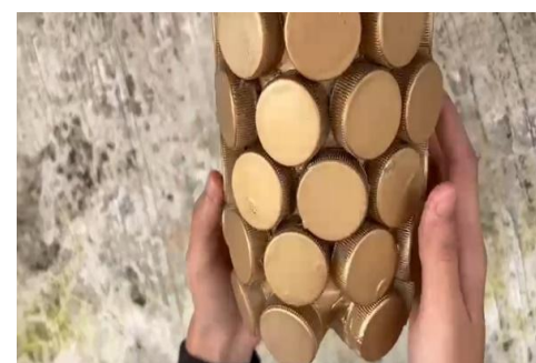
Proses pewarnaan vas bunga