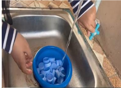
proses pencucian tutup botol

Pemanfaatan limbah dilakukan melalui beberapa langkah, yaitu pengumpulan, pemilahan, pembersihan, perancangan, perakitan, dan pewarnaan. Tutup botol plastik digunakan sebagai bahan utama untuk membuat vas bunga karena kekuatannya dan kemudahan dalam perakitan. Sementara itu, styrofoam digunakan sebagai bahan untuk membuat bunga dekoratif karena bobotnya yang ringan dan kemudahan dalam membentuknya. Proses ini menunjukkan bahwa limbah domestik non-organik dapat diproses secara kreatif melalui tahap-tahap yang sederhana.