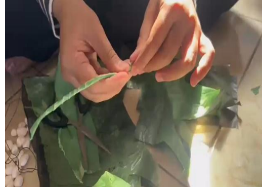
Proses pelilitan plastik ke besi untuk batang bunga