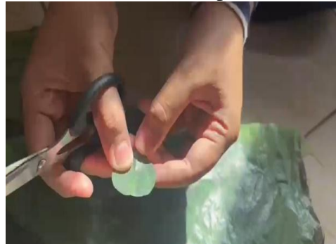
Proses pemotongan plastik untuk daun