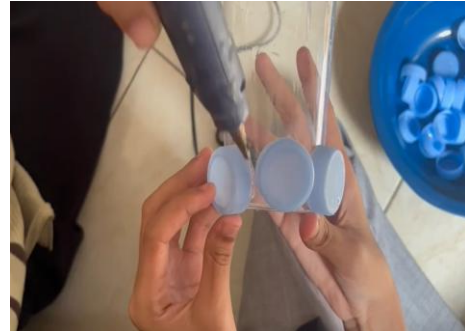
Proses perekatan tutup botol ke wadah vas bunga