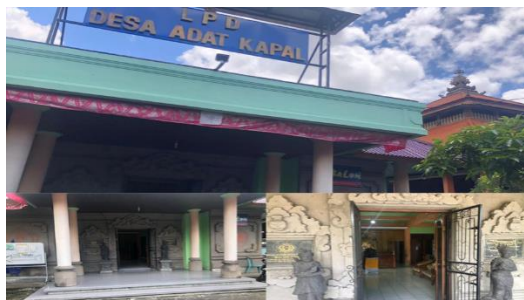
Gambar 1 Gedung LPD Desa Adat Kapal