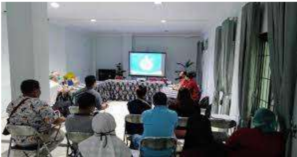
Gambar 1. Kegiatan Sosialisasi Penerapan 5M

Sosialisasi Penerapan 5M dilaksanakan pada tanggal 19 Juni 2023, diikuti oleh 30 peserta. Dalam sosialisasi tersebut tim pengabdian menyampaikan materi terkait "Pengertian infeksi nosokomial mulai dari pengertian, penyebab, tanda gejala dan pencegahan penularan infeksi silang" yang harus diketahui oleh pasien dan keluarga pasien di ruang rawat inap RSU Sari Mutiara Lubuk Pakam. Materi disampaikan dalam bentuk ceramah dan diskusi.