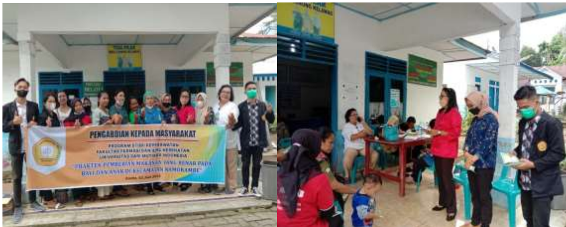
Gambar 1: Penyampaian Materi dan Foto bersama ibu batita

Hasil Kegiatan pengabdian kepada masyarakat didapatkan 23 peserta yang mengikuti kegiatan. Kegiatan Pelaksanaan Pengabdian Kepada Masyarakat juga dihadiri oleh Petugas kesehatan Desa Kelawas dan Bidan Kecamatan Namorambe. Selama kegiatan berlangsung, para peserta kegiatan tampak serius dan antusias mendengarkan informasi yang disampaikan oleh tim. Saat sesi diskusi/tanya jawab, peserta juga antusias bertanya tentang hal yang mereka belum pahami, paling banyak peserta bertanya pada bagian cara mengolah makanan yang benar untuk anak balita sehingga tidak menghilangkan nilai gizi pada makanan.