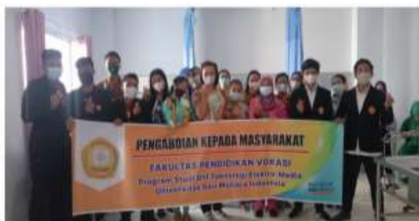
Gambar 3. Foto pengabdian kepada masyarakat