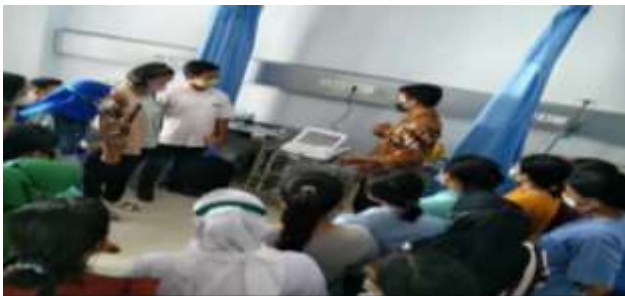
Gambar 2. Sosialisasi pengoperasian alat