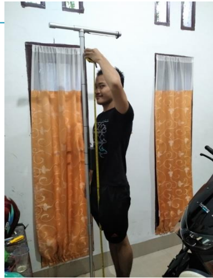
Gambar Tampilan Pengukuran menggunakan Modul