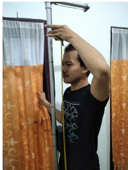
Gambar Tampilan pengukuran pada Mikrotoise