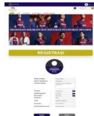
Gambar 9. Halaman Registrasi