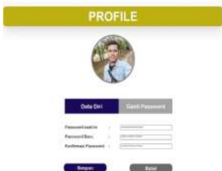
Gambar 12. Halaman Ganti Password