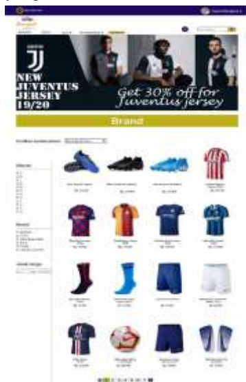
Gambar 7. Halaman Katalog Brand