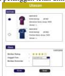
Gambar 19. Halaman Status Pesan Dikirim

Gambar 19 dibawah ini merupakan halaman yang akan dilihat oleh pelanggan pada saat barang pembelian pelanggan telah dikirim