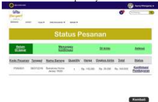
Gambar 18. Halaman Status Pesanan Menunggu Konfirmasi

Gambar 18 dibawah ini merupakan halaman status yang akan dilihat oleh pelanggan setelah melakukan konfirmasi pembayaran