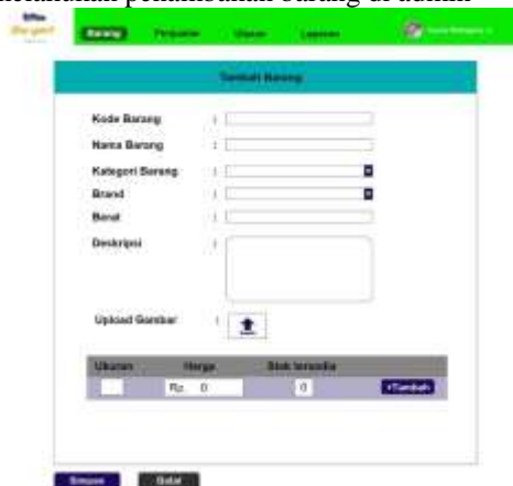
Gambar 26. Halaman Tambah Barang

Gambar 26 merupakan tampilan pada saat akan melakukan penambahan barang di admin