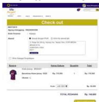
Gambar 15. Halaman Checkout Pesanan

Gambar 15 ini merupakan halaman checkout pesanan setelah pelanggan melakukan pembelian