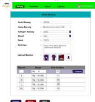
Gambar 27. Halaman Detail Barang

Gambar 27 merupakan tampilan detail barang yang dapat ditambahkan melalui admin