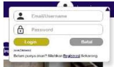
Gambar 8. Halaman Login