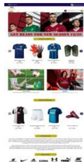
Gambar 10. Halaman Beranda Pelanggan an