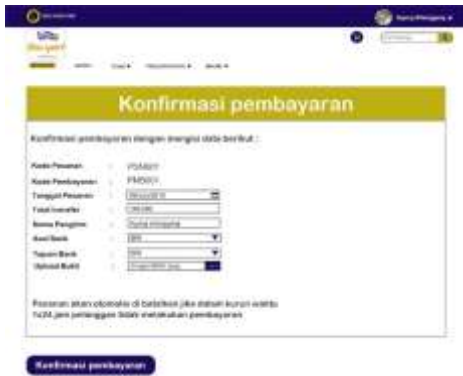
Gambar 17. Halaman konfirmasi Pembayaran