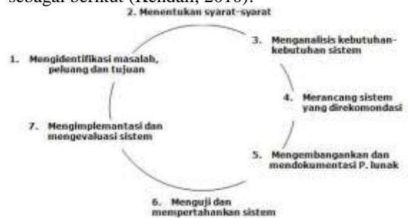
Gambar 1. Siklus Hidup Pengembangan Sistem

Siklus Hidup Pengembangan Sistem (SHPS) atau biasa disebut dengan System Development Life Cycle (SDLC) merupakan pendekatan melalui beberapa tahap untuk menganalisis dan merancang sistem yang dimana sistem tersebut telah dikembangkan dengan sangat baik melalui penggunaan siklus kegiatan penganalisis dan pemakai secara spesifik. Proses dari Siklus Hidup Pengembangan Sistem terdiri dari 7 tahapan sebagai berikut (Kendall, 2010):