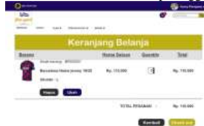
Gambar 14. Halaman Keranjang Belanja

Gambar dibawah ini merupakan halaman yang akan dilihat oleh pelanggan saat