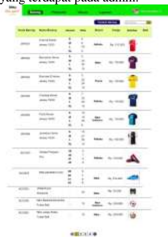
Gambar 25. Daftar Barang pada Admin

Gambar 25 dibawah ini merupakan tampilan daftar barang yang terdapat pada admin.