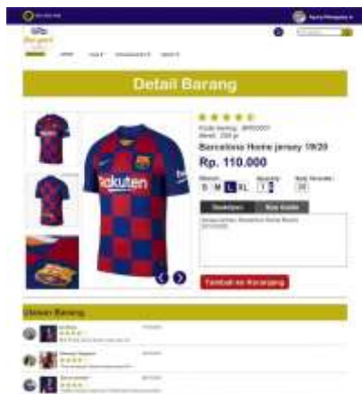
Gambar 13. Halaman Detail Barang dan Ulasan

Gambar 13 dibawah ini akan menampilkan detail barang yang akan dilihat oleh pelanggan dan juga ulasan yang diberikan pada produk tersebut