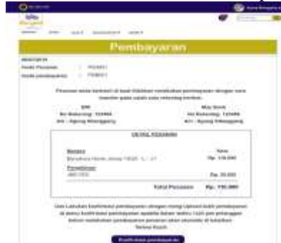
Gambar 16. Halaman Pembayaran

Pada gambar 16 merupakan tampilan yang akan dilihat user saat akan melakukan pembayaran.