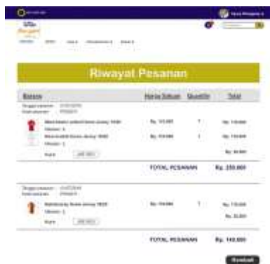
Gambar 24. Halaman Riwayat Pemesanan