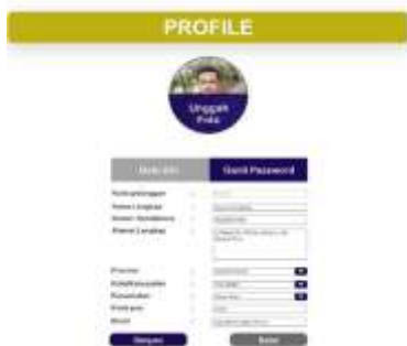
Gambar 11. Halaman Profil