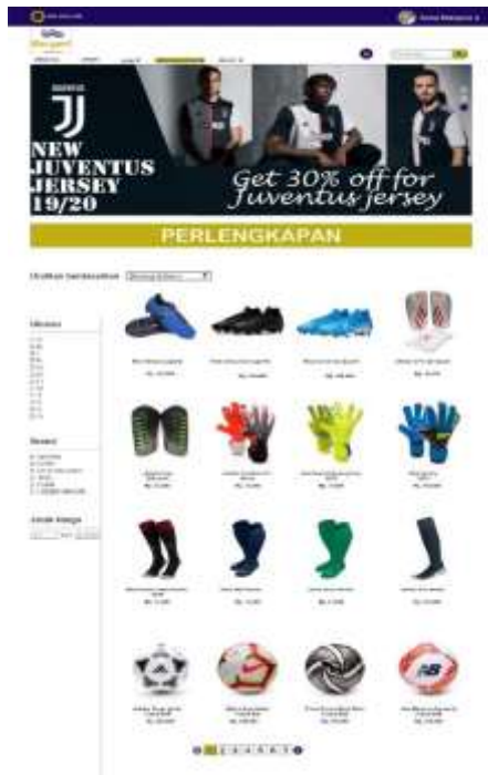
Gambar 6. Halaman Katalog Perlengkapan