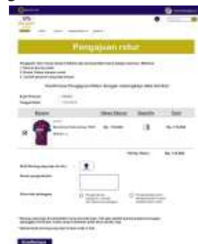
Gambar 22. Halaman Pengajuan Retur

Gambar 22 merupakan halaman yang akan dilihat oleh pelanggan saat melakukan pengajuan retur atas barang yang telah dibeli