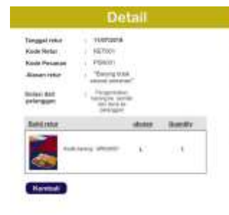
Gambar 23. Halaman Retur diterima

Gambar 23 merupakan tampilan yang akan dilihat oleh pelanggan supaya pelanggan dapat mengetahui status atas barang yang telah diretur.