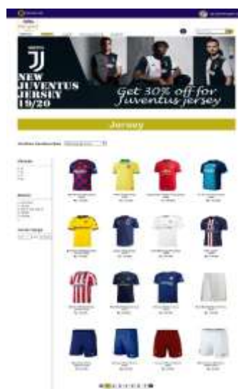
Gambar 5. Halaman Katalog Jersey