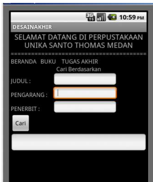
Gambar 2. Form Pencarian Buku

Pada gambar diatas pencarian buku dapat dilakukan berdasarkan kriteria yakni : judul, pengarang dan penerbit.