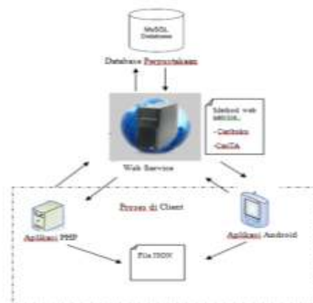
Gambar 1. Arsitektur Sistem Pada Perpustakaan

Pada perancangan aplikasi web-service Perpustakaan ini web service digunakan untuk melakukan pencarian buku dan tugas akhir yang masing-masing mempunyai method atau fungsi. Kelas pencarian buku mempunyai method caribuku yang berfungsi untuk mencari buku berdasarkan kriteria yang dikirim dari client. Method ini akan meminta masukan/ input judul,pengarang dan penerbit yang akan di-cek oleh aplikasi kemudian akan diberikan keluaran/ output nilai dalam bentuk JSON. Pada Kelas pencarian tugas akhir mempunyai method cariTA yang berfungsi untuk mencari tugas akhir berdasarkan kriteria yang dikirim dari client. Method ini akan meminta masukan/ input judul dan jurusan yang akan di-cek oleh aplikasi kemudian akan diberikan keluaran/ output nilai dalam bentuk JSON. Arsitektur sistem perpustakaan disajikan pada gambar 1.