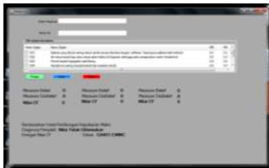
Gambar 5 Form Diagnosa