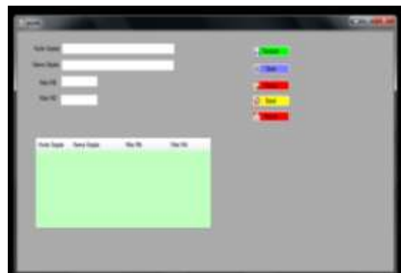
Gambar 4 Form Data Gejala

Form Input data gejala merupakan Form yang digunakan untuk menginput dan merubah database tanpa harus masuk ke dalam database langsung, berikut ini merupakan tampilan Form data gejala terdapat pada Gambar 4.