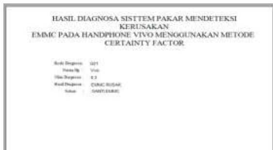
Gambar 6 Form Laporan Hasil Diagnosa

Form Laporan Hasil Diagnosa Kerusakan EMMC dengan Cristal Report Form yang digunakan untuk melihat hasil yang sudah selesai dari perhitungan Certainty Factor terdapat pada Gambar 6.