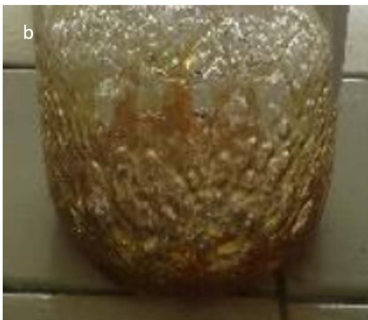
Gambar 1 (a) Hasil Carbon dots tanpa penambahan urea, (b) penambahan 10 gram urea