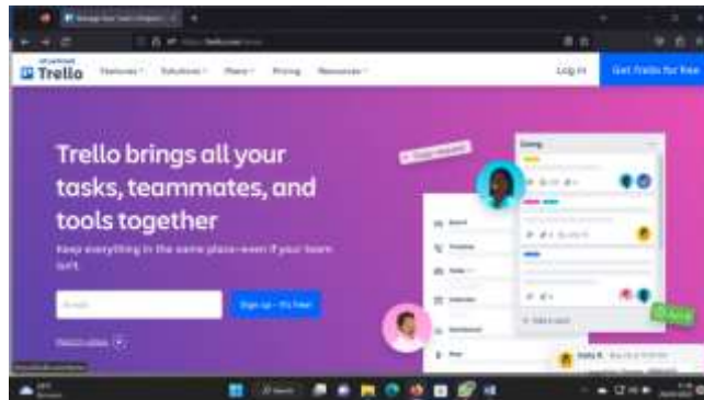
Gambar 1. Trello

Membuka trello melalui aplikasi Browser https://trello.com dengan memasukkan kata pada search engine trello yang terdapat pada Gambar 1.