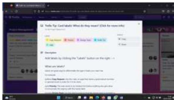
Gambar 5. Tampilan Your Boards