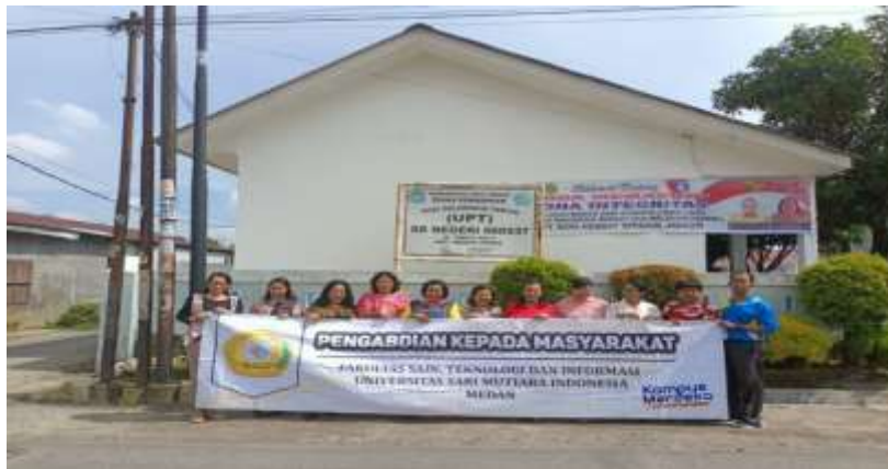
Gambar 1. Pengabdian kepada Masyarakat di SDN 060933 Kotamadya Medan