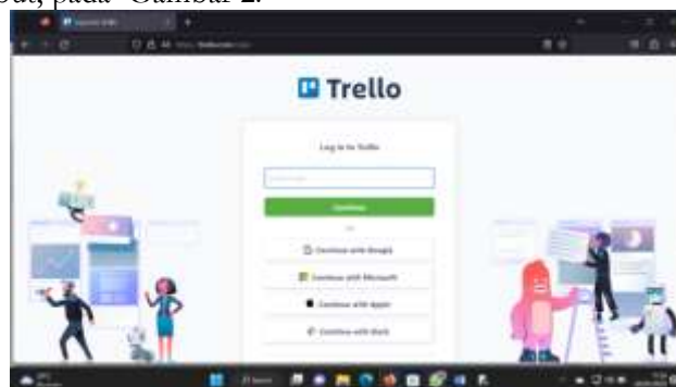
Gambar 2. Verifikasi Email

Sebagai contoh email dari google yaitu gmail.com dengan email : riahukur@gmail.com yang mendapat verikasi dari alamat email tersebut, pada Gambar 2.