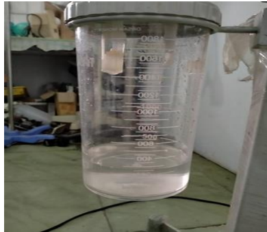
Set vacum -40 kPa