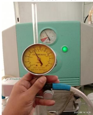
Set vacum -60 kPa