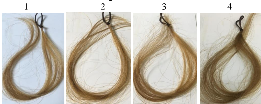
Gambar 1. Pengaruh Waktu Perendaman Hasil Pewarnaan Rambut Uban

Berdasarkan hasil pengamatan terhadap percobaan yang telah dilakukan diketahui bahwa lamanya waktu perendaman mempengaruhi hasil pewarnaan rambut uban seperti terlihat pada Gambar 1 dibawah ini yang diambil dari Formula B.